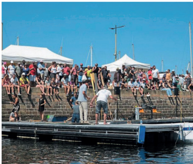
Le public est massé, quai de la Digue pour assister au championnat de godille. Certains sont venus encourager les sportifs tout au long de la journée.

(1) Le championnat du monde se déroulera, cette année, sur l'Île-de-Batz (Finistère), les 14 et 15 septembre.