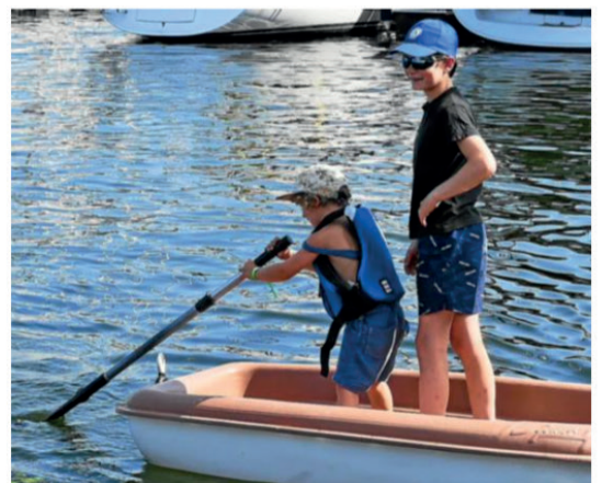
Il n'y a pas d'âge pour godiller !