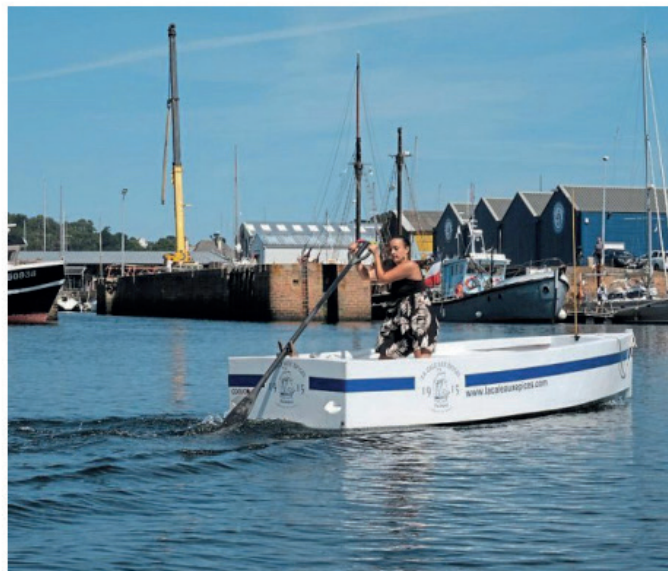
Pour la troisième fois, le championnat de godille était organisé à Paimpol par le yacht-club de Trébeurden. Un événement qui se déroule, d'une année sur l'autre, dans l'une de ces deux communes.