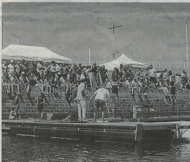
Le public est massé, quai de la Digue pour assister au championnat de godille. Certains sont venus encourager les sportifs tout au long de la journée.

(1) Le championnat du monde se déroulera, cette année, sur l'île-de-Batz (Finistère), les 14 et 15 septembre.